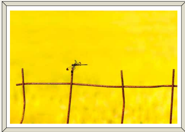
好日 中島 弘一

秋の日の穏やかな時の流れに身を任せ、一面に黄葉した稲穂の中で、静かに時を過ごせる平穏な地球の好日。こんな思いを込めての一コマです。政治に、経済に、地域紛争にと、何かと息苦しい世の中にあって、私達に心の休まる時を与えられるのは、アートとしての写真の一つの役割ではないでしょうか。産卵のために、山から平地に戻ってきた「アキアカネ」が一休みする情景を、滋賀県の湖北の秋をバックに撮影した写真です。