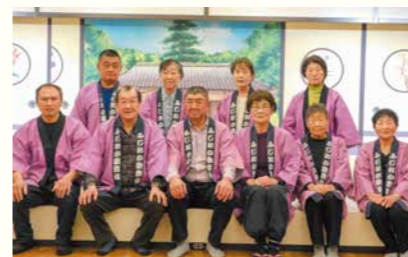
伝統芸能 藤岡歌舞伎 (フジオカカブキ)

今から46年前、公民館の油絵講座が再開の第一歩でした。これまでに巡り合った恩師、仲間たち、又協力してくれた家族に感謝しています。この受賞を亡き先生方が何よりも喜んでくださったかと思ひ、感慨深いものがあります。