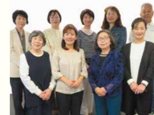
文化交流 TIAボランティアグループ E-IFF (ティーアイエボランティアグループ イーアイエフ)

我々は平成14年に結成し現在まで農村歌舞伎の上演と子ども歌舞伎の指導を行ない伝統芸能の継承に努めています。今回このような榮譽ある賞をいただき会員一同今後の活動の励みとさせていただきます。本当にありがとうございました。