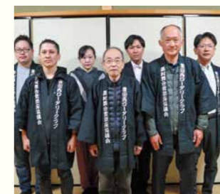
地域文化 農村舞台寶榮座協議会 (ノウソンプタイホウエイザキョウギカイ)

このたびは身に余る賞を賜り、感謝申し上げます。スカウト一人ひとりの成長と、支えてくださる地域の皆様への感謝を胸に、今後もスカウト運動の精神を次世代へつなげていけるよう努めてまいります。