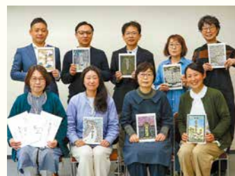
オール・ヒストリー あすけ聞き書き隊 (アスケキキガキタイ)

この度は榮譽ある賞を賜りまして大変光栄に存じます。推薦して下さった方をはじめ、ご教示いただいた講師の先生、話し手である足助の方々やご協力いただいた皆さまに感謝しております。言葉が紡いだ繋がりが、一層多くの方に広がっていく機会がまたひとつ増えたようで、大変嬉しくっております。