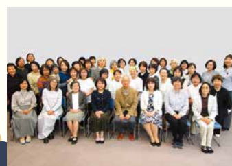
文化振興 こども図書室ボランティア (コドモトシヨシツボランティア)

この度は、榮譽ある賞をいただき誠に光栄に存じます。多くの方々に支えられて舞踊を続けることができました。これも皆様のおかげと感謝の気持ちでいっぱいです。今後もこれを新たな出発として精進してまいります。